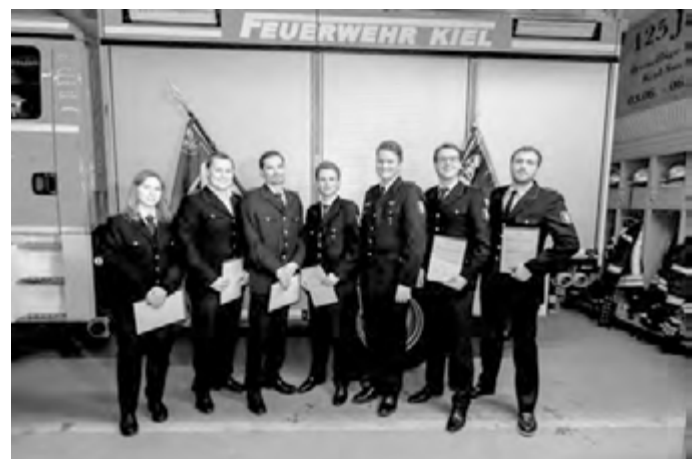
Die neuen Feuerwehrfrauen und Feuerwehrmänner nach bestandener Anwärterzeit.