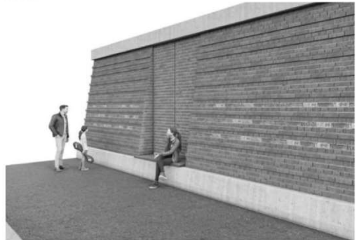
Detail der geplanten Uferwand mit den Bürgersteinen

Für die Reservierung der Bürgersteine wird eine Schutzgebühr von 12 Euro erhoben. Alle Erlöse aus dem Bürgersteinfest werden der Jugendfeuerwehr Suchsdorf für eine Sommerfahrt zur Verfügung gestellt.