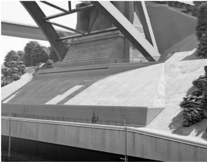
Visualisierung der geplanten südlichen Ufersicherung

Das Wasserstraßen Neubauamt Nord-Ostsee-Kanal (WNA NOK) stellt „Bürgersteine“ zur Verfügung. Diese sind Ziegelsteine, welche, von Anwohner*innen auf dem Bürgersteinfest am 7. Juli 2024 gestaltet, später in eine Mauer unterhalb der neuen Levensauer Hochbrücke integriert werden.