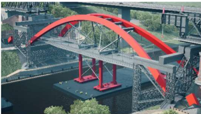
So wie in dieser Animation könnte das Einschwimmen des neuen Brückenbogens aussehen

Für die Schifffahrt wird der Kanal im Jahr 2027 also zweimal für je 48 Stunden für das Abbauen und das Aufbauen der Brücke gesperrt. Der Bahnverkehr ruht von Mitte April 2027 bis zum Herbst des Jahres. Der Individualverkehr auf Straße und Fußweg wird Anfang Januar 2027 gesperrt und bleibt noch einige Monate länger gesperrt als der Bahnverkehr.