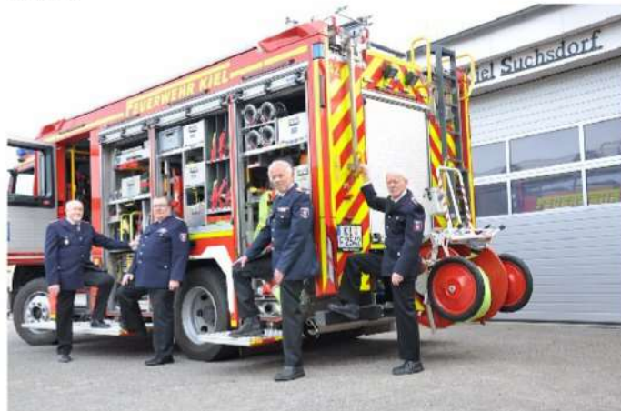
Ehrenmitglieder mit über 200 Jahren Feuerwehr-Erfahrung